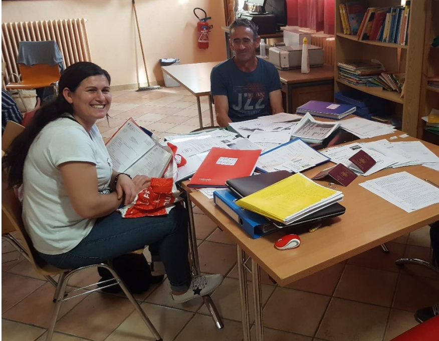
Préparation des dossiers de demande de titre à la Cimade

Les deux grands poursuivent leurs études, et le dernier a intégré la maternelle.