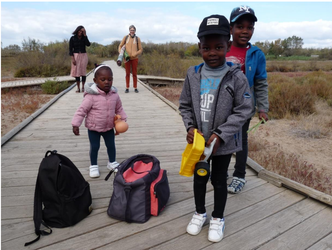
Sortie à la plage mi-octobre

Nous espérons qu'ils pourront demander un titre de séjour en 2022.